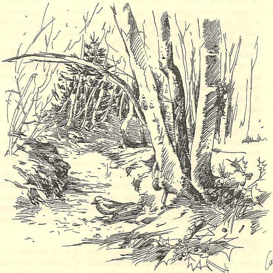
Dessin réalisé par Cathy Gaspoz (Les Loges)