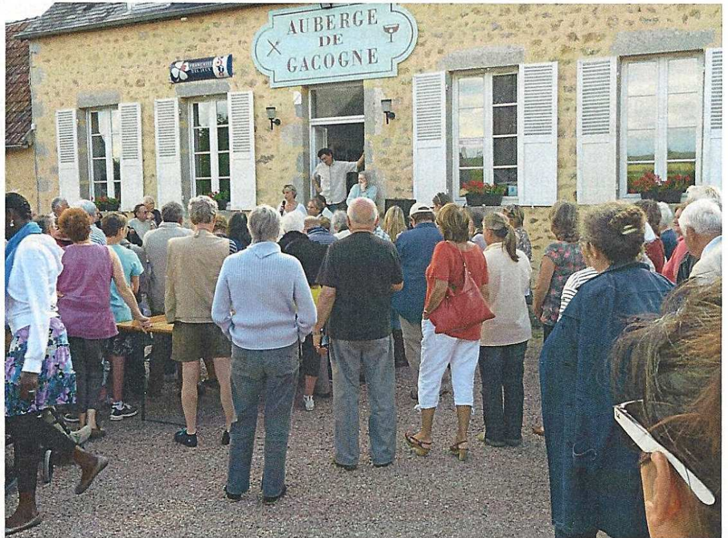
Pot d'accueil des nouveaux aubergistes – 21 juillet 2012

Sous Chemin Les Loges La Chaume des Ponts L'Huis Bourdiaux Jailly Saugny Le Moulin Granard Tachely Les Granges Lavault Le Mont Le Bourg Le Petit Cart Le Joyau La Porouse Beauregard Longues Vernes Raffigny L'Huis Brochard L'Huis Dupin Le Saloir La Roche La Frasse L'Huis Gauthereau L'Huis au Fiot Le Verniau Les Plats Fragny La Gare Pert Parjot Le Gravet Rhuère La Coppe L'Huis Taupin L'Huis Boileau L'Huis Pillavoine L'Huis au Page